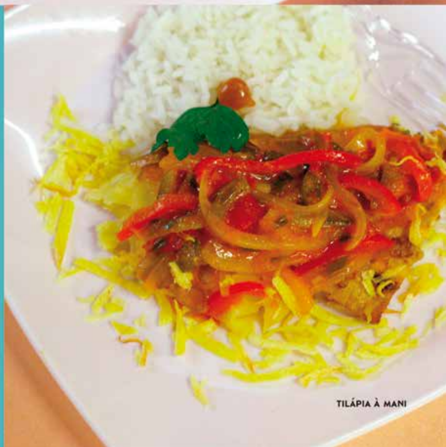
TILÁPIA À MANI

A TRADIÇÃO DA PESCARIA FAZ COM QUE A REGIÃO SE DESTAQUE NO PREPARO DE PEIXES, A TILÁPIA À MANI É IMPERDÍVEL. ENTÃO, APROVEITE PARA EXPERIMENTAR A DIVERSIDADE DE MODOS DE PREPARO E ELEGER O SEU FAVORITO. TAMBÉM VALEM A PENA O CHURRASCO SERVIDO COM MANDIOCA, A VACA ATOLADA E O PUCHERO.