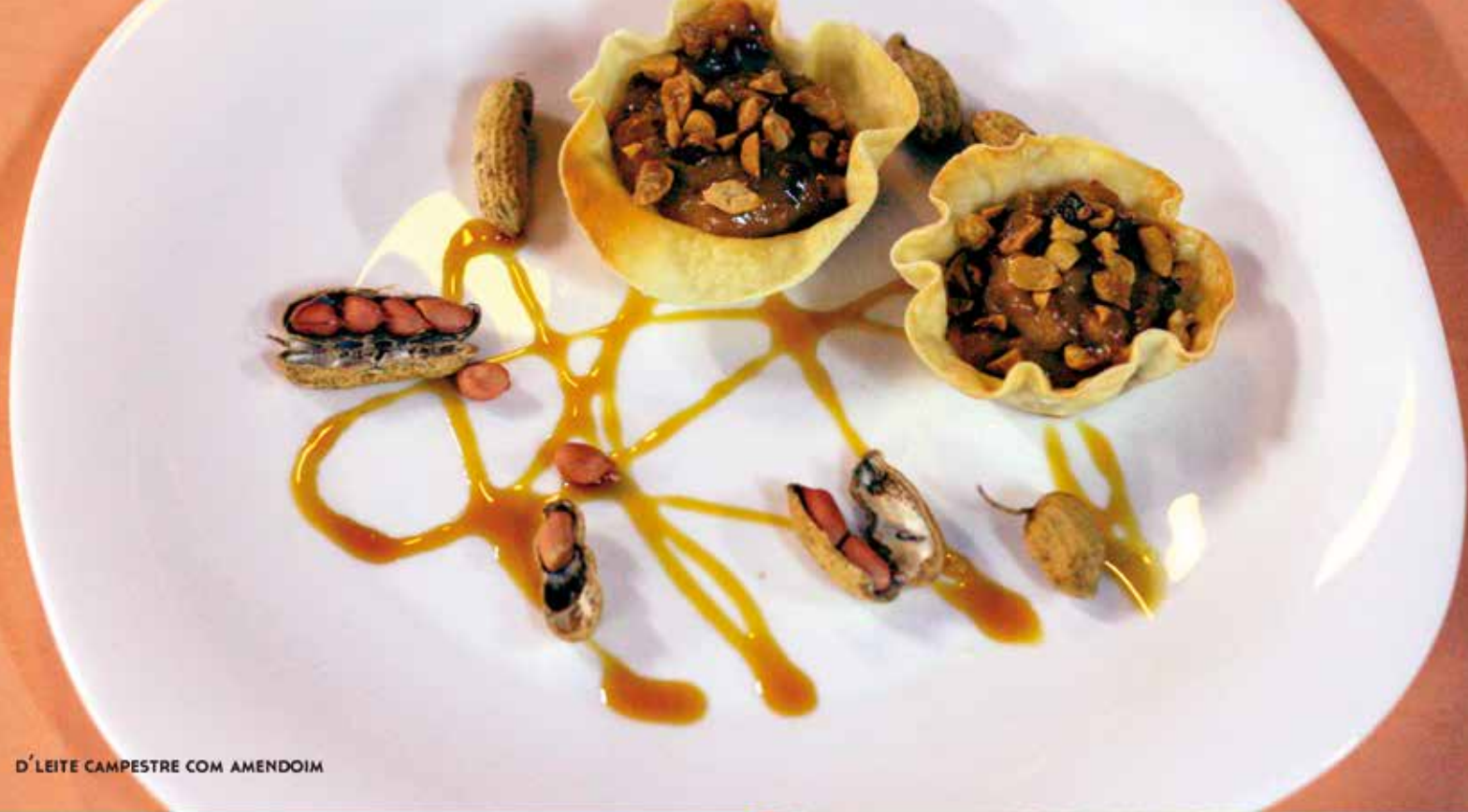
D'LEITE CAMPESTRE COM AMENDOIM

A TRADIÇÃO DA PESCARIA FAZ COM QUE A REGIÃO SE DESTAQUE NO PREPARO DE PEIXES, A TILÁPIA À MANI É IMPERDÍVEL. ENTÃO, APROVEITE PARA EXPERIMENTAR A DIVERSIDADE DE MODOS DE PREPARO E ELEGER O SEU FAVORITO. TAMBÉM VALEM A PENA O CHURRASCO SERVIDO COM MANDIOCA, A VACA ATOLADA E O PUCHERO.