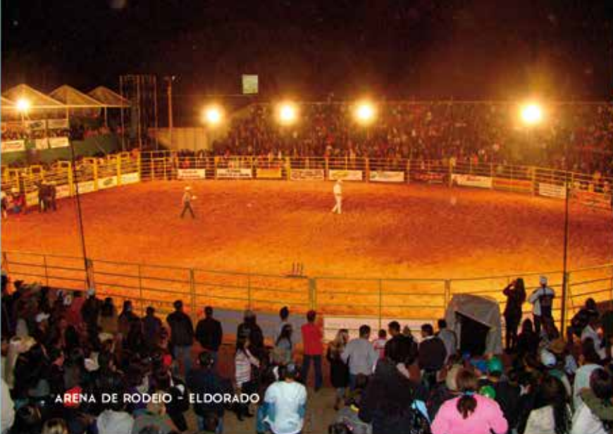
ARENA DE RODEIO - ELDORADO