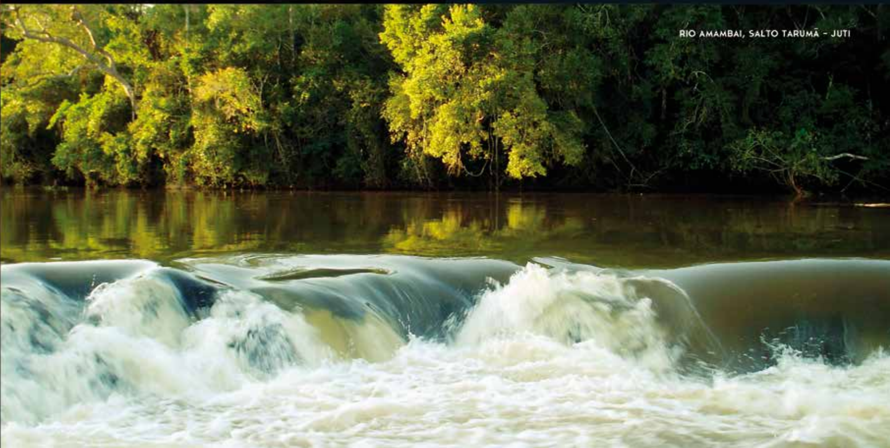
RIO AMAMBAI, SALTO TARUMÃ - JUTI

ENTRE UNIDADES DE CONSERVAÇÃO, PARQUES MUNICIPAIS, BOSQUES E O PARQUE NACIONAL DE ILHA GRANDE, A NATUREZA FAZ UM CONVITE AOS TURISTAS DA REGIÃO: RESPIRE FUNDO E APROVEITE. BOSQUES, CACHOEIRAS, PRAIA DE ÁGUA DOCE, PESCA ESPORTIVA, SÍTIO ARQUEOLÓGICO, QUEDAS D'ÁGUA COLORIDAS PELOS CARDUMES DE PEIXES, GRUTA COM FONTE DE ÁGUA MINERAL. SÃO ATRATIVOS PARA ENTRAR EM HARMONIA COM A NATUREZA E CONSIGO MESMO.