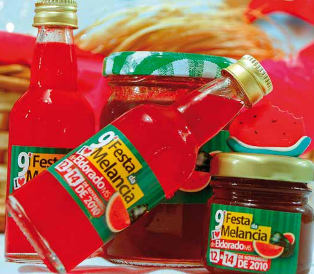
PRODUTOS DERIVADOS DA MELANCIA - ELDORADO