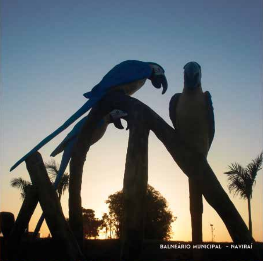
BALNEÁRIO MUNICIPAL - NAVIRAÍ

ENTRE UNIDADES DE CONSERVAÇÃO, PARQUES MUNICIPAIS, BOSQUES E O PARQUE NACIONAL DE ILHA GRANDE, A NATUREZA FAZ UM CONVITE AOS TURISTAS DA REGIÃO: RESPIRE FUNDO E APROVEITE. BOSQUES, CACHOEIRAS, PRAIA DE ÁGUA DOCE, PESCA ESPORTIVA, SÍTIO ARQUEOLÓGICO, QUEDAS D'ÁGUA COLORIDAS PELOS CARDUMES DE PEIXES, GRUTA COM FONTE DE ÁGUA MINERAL. SÃO ATRATIVOS PARA ENTRAR EM HARMONIA COM A NATUREZA E CONSIGO MESMO.