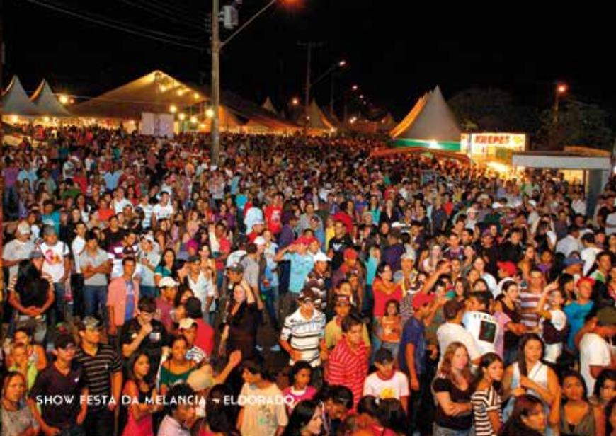
SHOW FESTA DA MELANCIA - ELDORADO