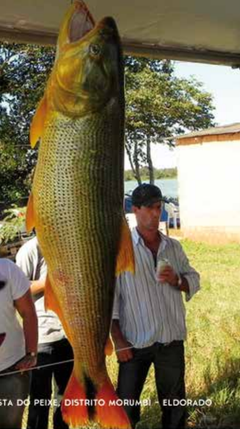
ESTA DO PEIXE, DISTRITO MORUMBI - ELDORADO