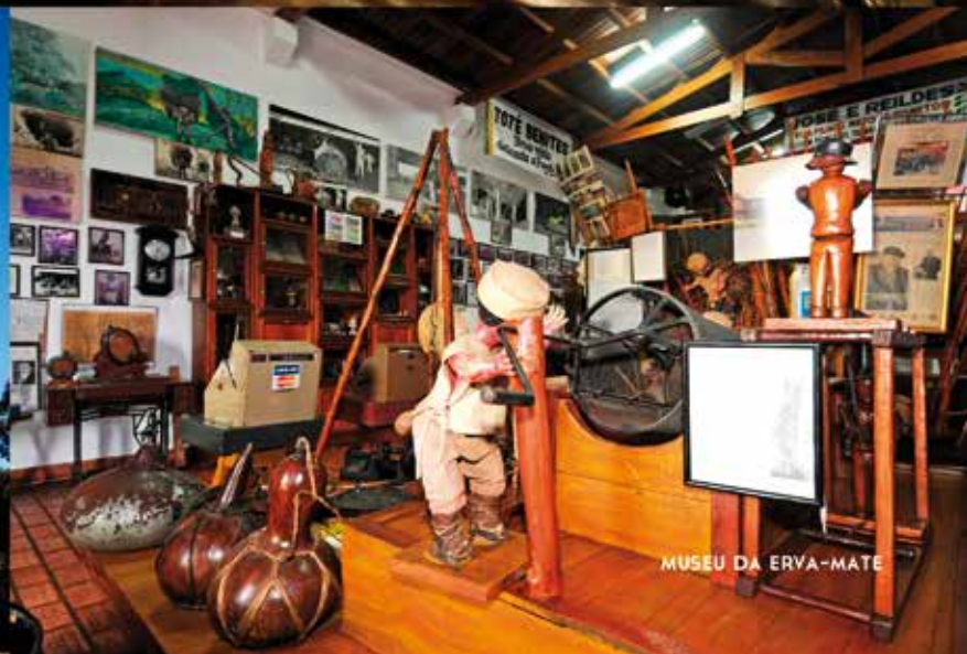
MUSEU DA ERVA-MATE